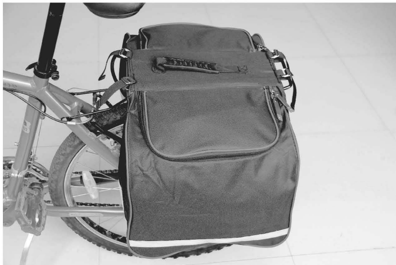
Befestigte Gepäckträgertasche am Gepäckträger

Entsprechend Bild 8 mit der anderen Seite des Gepäckträger-Rahmens verfahren.