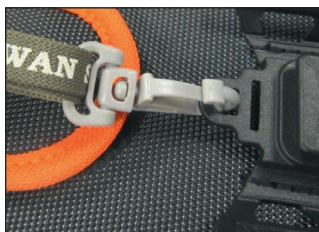
Befestigungsband mit Karabinerhaken

Durchmesser des Karabinerhakens: max. 5 mm.